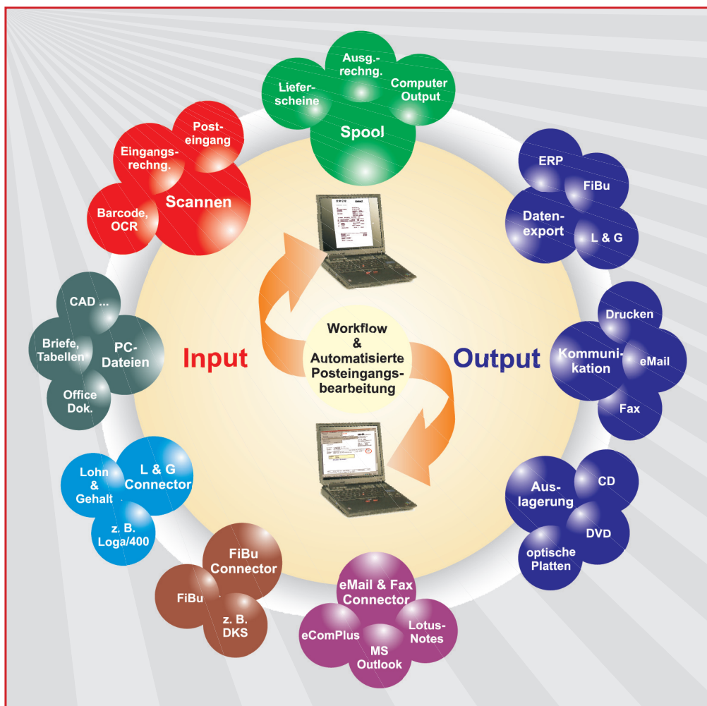
Die Dokumenten-Management- und Archiv-Lösung für IBM System i

eComPlus ist die Messaging Lösung für eMail, Fax und SMS . Damit können auch archivierte Dokumente papierlos kommuniziert werden.